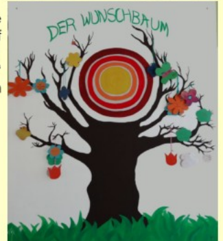
Jugendgruppe Jaqueline Wolf Kinder-Reha-Klinik „Am Nikolaus Holz“ Bad Kösen