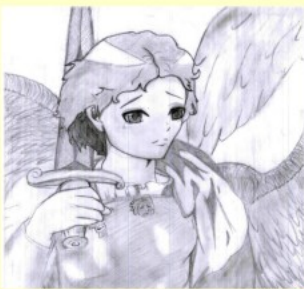
Susanne Wulff Pestalozzischule Naumburg

Die Sieger werden an einem Workshop in Klingers Radierstübchen teilnehmen. Herzlichen Glückwunsch vom Landrat und dem Vorstand des Kunstvereins Naumburg!