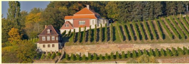
Alterswohnsitz des 1920 verstorbenen Leipziger Bildhauer und Grafiker Max Klinger

Die Sieger werden an einem Workshop in Klingers Radierstübchen teilnehmen. Herzlichen Glückwunsch vom Landrat und dem Vorstand des Kunstvereins Naumburg!