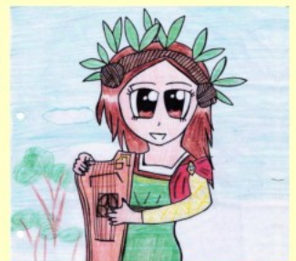
Lousiana Graff Pestalozzischule Naumburg