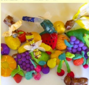
Jugendgruppe Garnet Meiß Salztorschule Naumburg In der Kinderbücherei